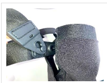
ヒップバッグ完成後、 ショルダーストラップを取り付ける