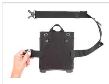
バッグ背面のポケット部の中に ヒップストラップを通す