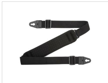
ショルダーストラップ