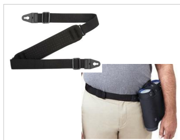
ショルダーストラップ + ヒップバッグ