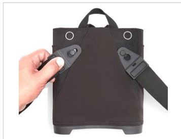
所定の位置に取り付ける