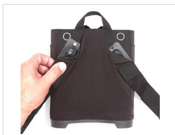
所定の位置に取り付ける